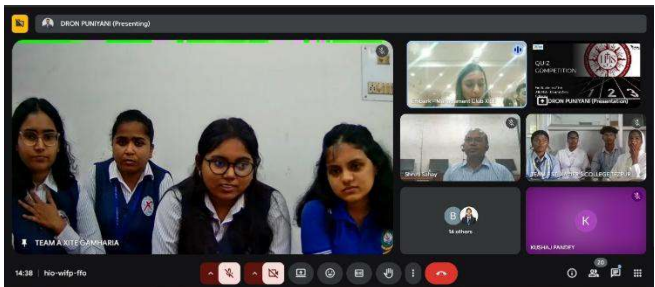
XITE, Gamharia, Jamshedpur