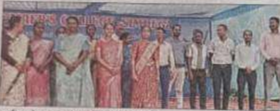
कार्यक्रम के शुभारंभ के मौके पर मौजूद अतिथि.