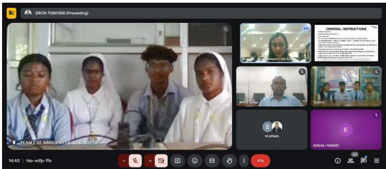
SXC, Tezpur, Assam