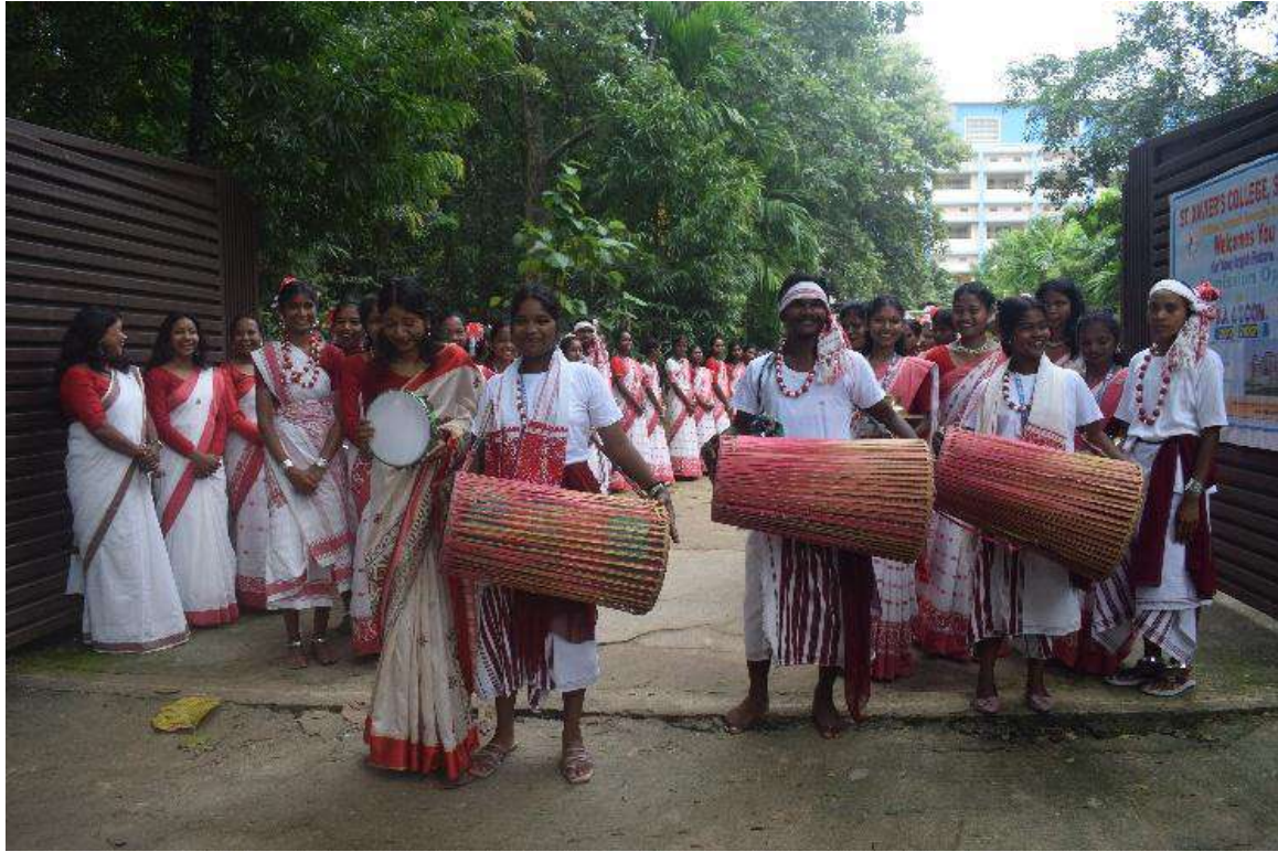
Welcome of Chief Guest