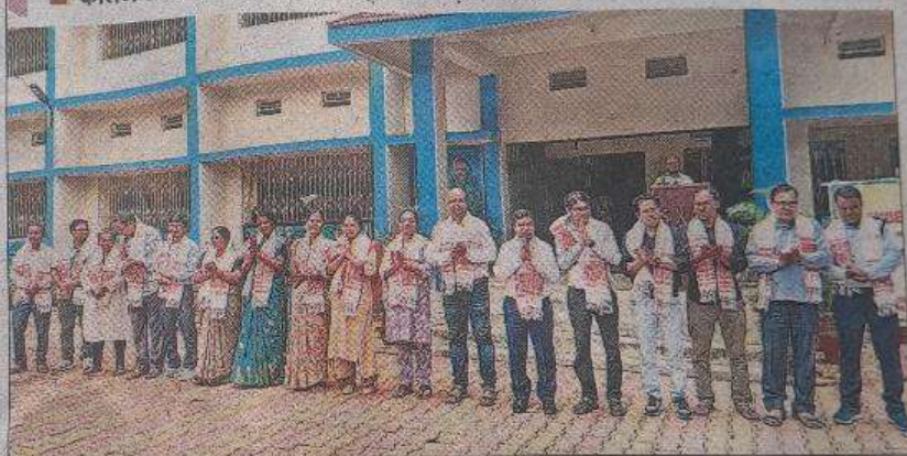
सिमडेगा में शनिवार को कॉलेज के स्थापना दिवस कार्यक्रम में उपस्थित कॉलेज के शिक्षक और कर्मचारी। • हिन्दुस्तान

भी प्रयास कर रहे हैं। उन्होंने शिक्षकों, अभिभावकों एवं छात्रों से सहयोग की अपील करते हुए कहा कि हम सब मिलकर संत जेवियर कॉलेज को एक शैक्षणिक उत्कृष्टता का केंद्र बनाएंगे जहां ज्ञान, मूल्य और नवाचार तीनों