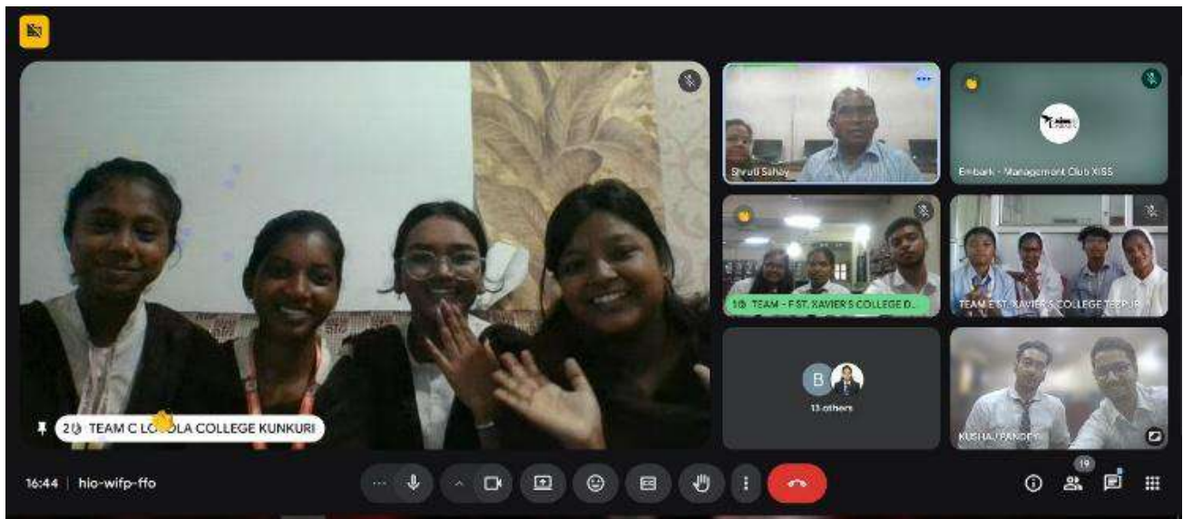
Loyola College, Kunkuri, CG